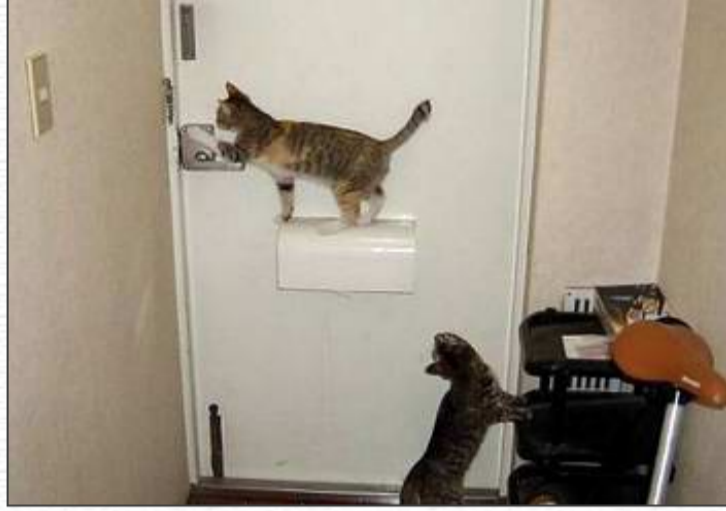
Bunlardan korkulur ama!...